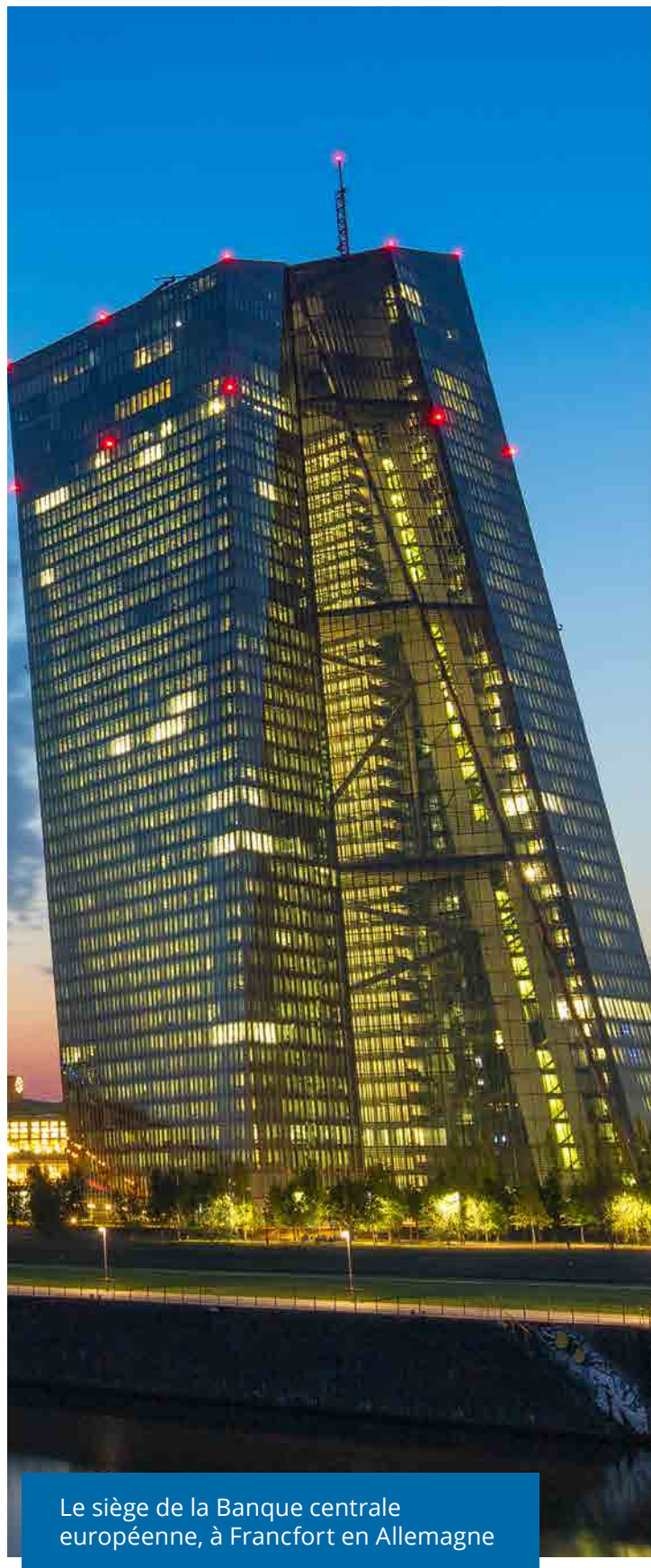
Le siège de la Banque centrale européenne, à Francfort en Allemagne

Last but not least , les publications de résultats des sociétés cotées tendent à dépasser les espérances. Ceux du premier trimestre ont agréablement surpris et l'année 2021 devrait, fait rare, être marquée par une révision à la hausse de la croissance des profits. D'habitude, c'est l'inverse qui se produit : les analystes financiers sont trop optimistes puis ajustent leurs estimations après des résultats inférieurs à leurs attentes du début d'année. La plupart des secteurs ayant retrouvé des couleurs en Bourse, l'heure des choix valeur par valeur a sonné. Celles qui continueront à surpasser les anticipations, dotées d'un management ayant fait ses preuves et de solides fondamentaux, continueront à surperformer. Rendez-vous dès mi-juillet, lors de l'annonce des premiers résultats du deuxième trimestre. ■