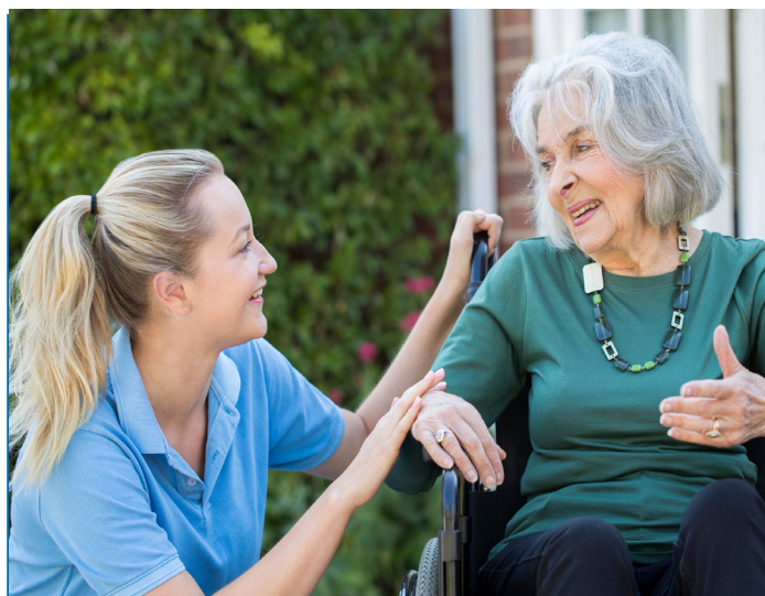
La dernière loi de finances a clarifié les modalités du crédit d'impôt pour l'emploi d'un salarié à domicile

Le dispositif « Louer Abordable », aussi appelé « Loi Cosse ancien », basé sur une déduction fiscale appliquée sur les loyers inférieurs aux prix de marché, fixés dans le cadre d'un conventionnement avec l'Agence nationale de l'habitat (Anah), est prorogé et, à cette occasion, totalement refondu. Le dispositif devait prendre fin le 31 décembre 2022 ; il reste finalement en vigueur sous sa forme actuelle pour les conventions déposées au plus tard le 28 février 2022. « Louer Abordable » est transformé en réduction d'impôt, ce qui simplifie sa lecture et uniformise l'avantage fiscal, quelle que soit la tranche d'imposition. Le taux de la réduction d'impôt est fixé à 15% pour le logement affecté à la location intermédiaire et à 35% pour le logement affecté à la location sociale. Des majorations sont prévues en cas d'intermédiation locative via un organisme agréé par l'État, portant le taux de défiscalisation à 20% en location intermédiaire, à 40% en location sociale et à 65% en location très sociale. Les plafonds de loyers ne seront plus basés sur les zonages A, B ou C, mais en fonction des loyers réellement observés sur chaque commune. Le taux de